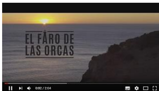
EL FARO DE LAS ORCAS , de Gerardo Olivares

Historias Cinematograficas Cinemania / Wanda Visión S.A./ Pampa Films / Puenzo Hermanos / El Faro de las Orcas AIE